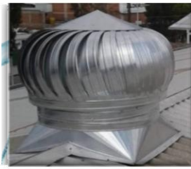
A DOS AGUAS